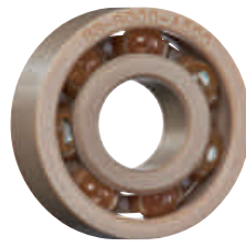
PEEK 保持器, 玻璃滾珠