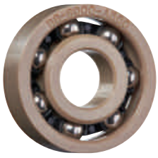
PA 保持器, 不銹鋼滾珠

由xirodur A500製成的內外環 - 化學和溫度穩定性高達+ 150° C