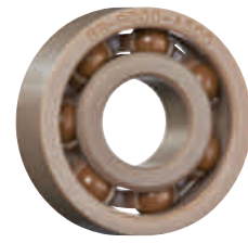
PEEK 保持器, PAI 滾珠