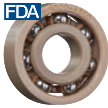
PEEK 保持器, 不銹鋼滾珠